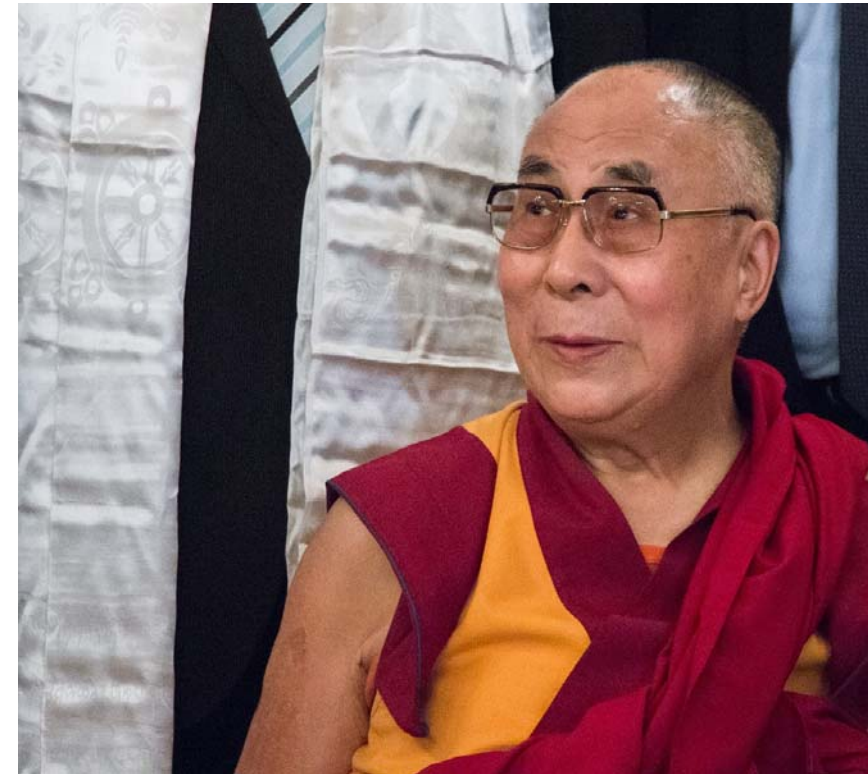
Martin Kraft ( https://commons.wikimedia.org/wiki/File:MK37694_Tenzin_Gyatso.jpg ), „MK37694 Tenzin Gyatso“, https://creativecommons.org/licenses/by-sa/3.0/legalcode